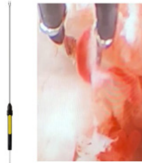
Figura 2. Ilustração mostrando o uso do instrumento durante procedimento intraventricular imerso no líquido cefalorraquidiano em paciente com hidrocefalia, visando coagular o plexo coroide (observar o uso da pinça PB SafeBlend 450 para coagular o vaso com o movimento de pinçamento). A ponta apresenta um movimento de prensão e é revestida com prata para evitar a aderência do tecido durante a coagulação.

Artur Henrique Galvão Bruno da Cunha https://orcid.org/0000-0002-8589-8563 Marcelo Moraes Valença https://orcid.org/0000-0003-0678-3782