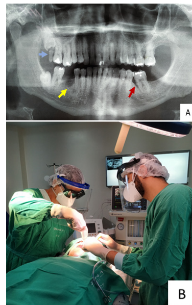
Figura 1. (A) Radiografia panorâmica dos maxilares. Perda óssea generalizada; dente com mobilidade na região de terceiro molar superior do lado direito (seta azul); resto radicular com abscesso dentoalveolar (seta amarela); bolsa periodontal (seta vermelha). (B) Adequação do meio bucal com monitoramento dos sinais vitais durante todo o procedimento odontológico.

Diante disso, foi discutido com a equipe médica a realização da adequação do meio bucal antes da cirurgia de troca valvar. Tratamento periodontal conservador e terapia fotodinâmica (aPDT), utilizando azul de metileno 0,01% e fotobiomodulação a laser (3 Joules de energia por ponto), foram realizados para controle da doença periodontal. Também, o resto radicular e o dente com mobilidade acentuada foram removidos sob anestesia local (prilocaína 3% com felipressina 0,03 UI/ml). Durante todo o procedimento, os sinais vitais do paciente foram monitorados, não apresentando intercorrências (Figura 1B). Após 10 dias, o paciente não apresentou complicações pós-operatórias, sendo liberado pela odontologia para realização da cirurgia de troca valvar.