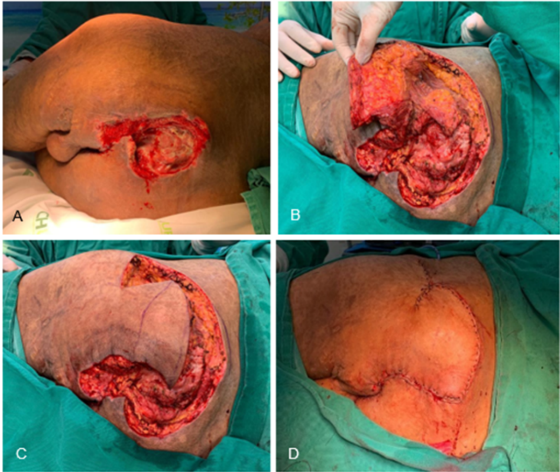
Figura suplementar S3. Segunda intervenção cirúrgica para reconstrução da região sacral. Realizado retalho miocutâneo do músculo glúteo maior