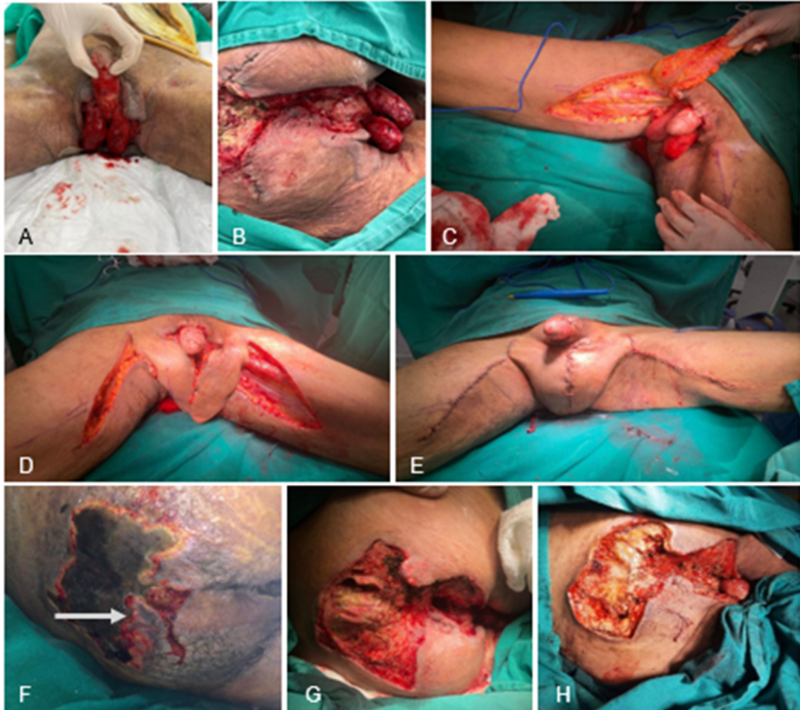
Figura suplementar S2. Primeira intervenção cirúrgica, realizado desbridamento para tratamento inicial da área de escara sacral (2G E 2H), que apresentava necrose úmida não purulenta e exposição óssea de sacro e cóccix (seta) (2F), além do ferimento perineal e genital, com exposição de testículo e corpo do pênis (2A E 2B). Ademais, confecção de retalho fasciocutâneo supramedial da coxa (2C E 2D) para formação de um neoscroto (2E), enquanto que o ferimento perineal foi tratado com fixação de retalho cutâneo em suas margens